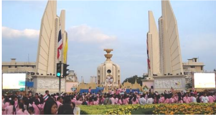
Ảnh: Người dân Thái Lan đang tập trung quanh Tượng đài Dân chủ tại thủ đô Bangkok. Tượng đài, với bản Hiến pháp 1932 nằm trên bệ ở trung tâm, đánh dấu sự chấm dứt của chế độ quân chủ tuyệt đối và chuyển sang quân chủ lập hiến (quân chủ đại nghị).

Ngoài các chức năng cơ bản nêu trên, một số hiến pháp còn đóng vai trò là văn bản tuyên bố các giá trị cốt lõi của một dân tộc và những định hướng phát triển của một đất nước.