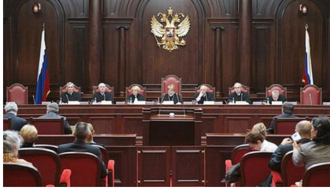
Ảnh: Một phiên xử của Tòa án Hiến pháp Nga, cơ quan được thành lập theo Hiến pháp CHLB Nga 1993.